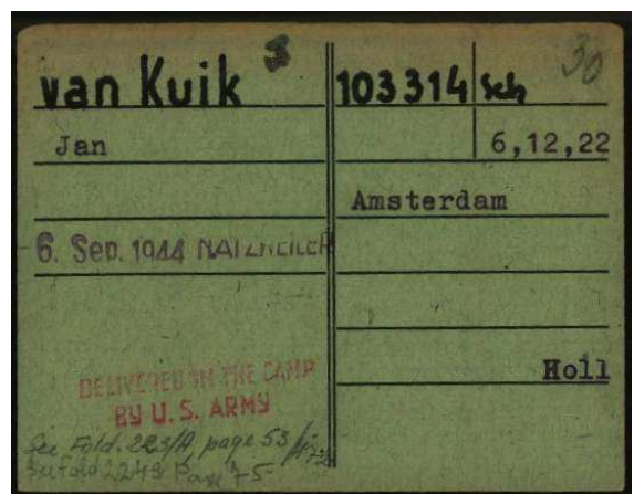
Schreibstubenkarte KZ Dachau

Op 29 april 1945 wordt Dachau bevrijd door de Amerikanen. "Ik kwam uit de barak en ik liep op de appèlplaats en daar kwam ik de eerste tegen. Ongelofelijk, ongelofelijk. Gelijk omhelzen. Maar ja, we bleven nog wel in onze barakken voorlopig..." Door de tyfusepidemie in het kamp kan de poort van het kamp niet onmiddellijk geopend worden.