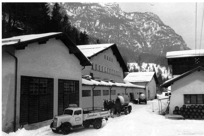
De bierbrouwerij in Garmisch-Partenkirchen