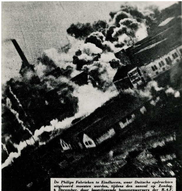
Engelse propagandafoto Sinterklaasbombardement